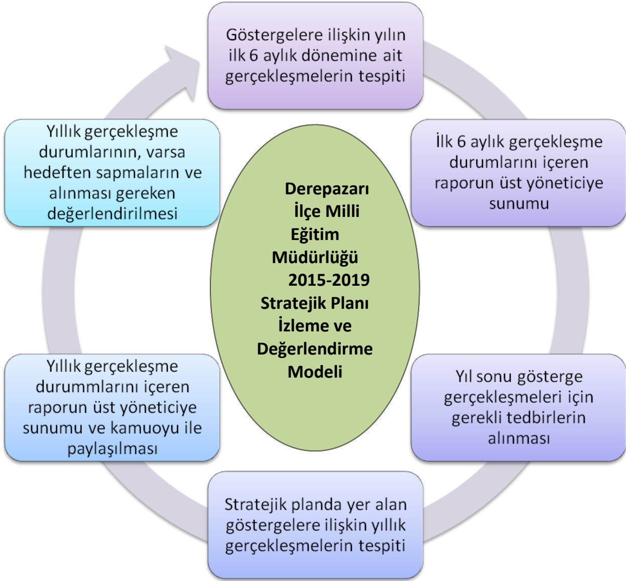
Şekil:4 İzleme ve Değerlendirme Panosu