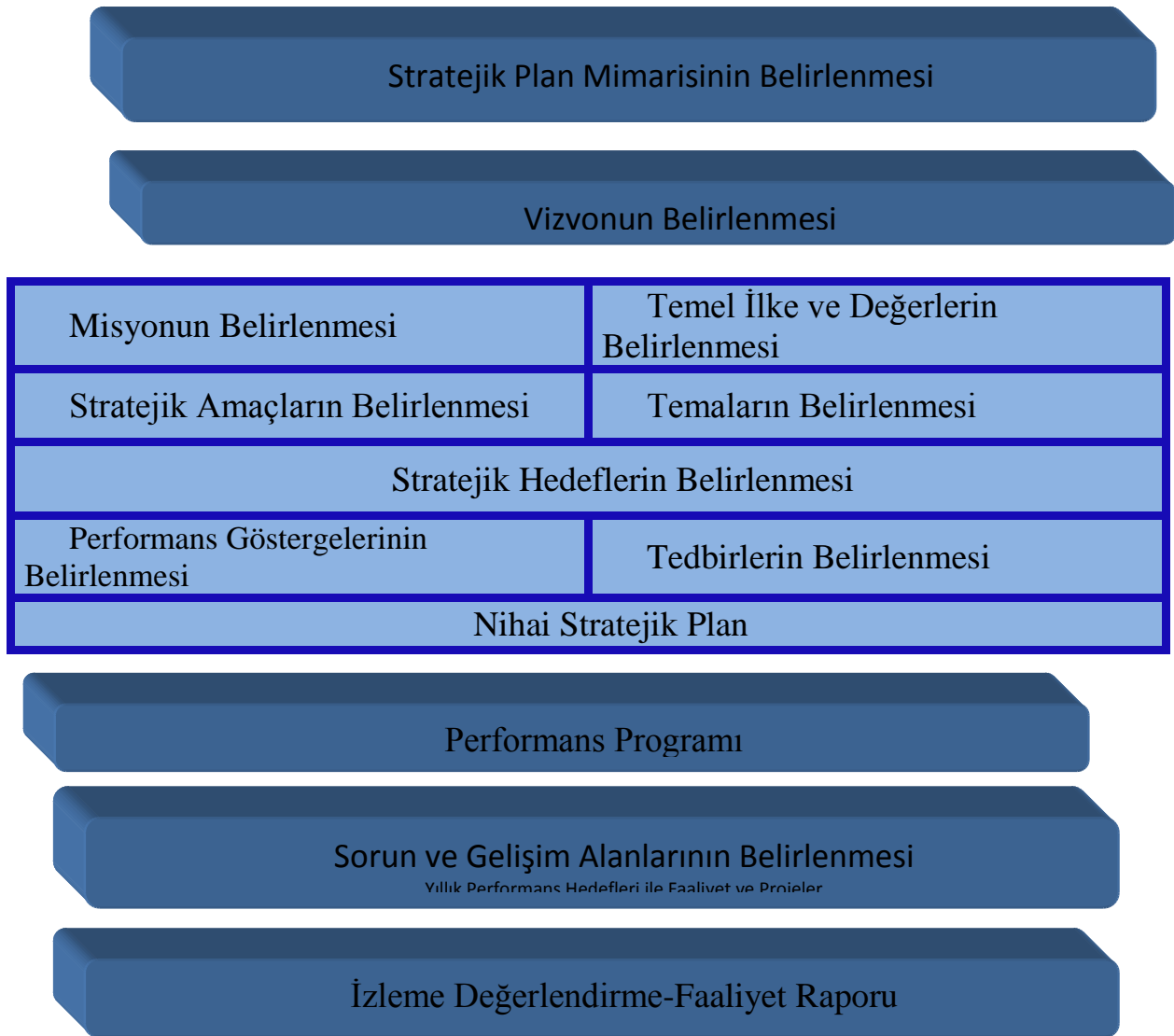
Şekil 1: Stratejik Planlama Modeli

Millî Eğitim Müdürlüğümüzün 2015-2019 Stratejik Planı, Milli Eğitim Bakanlığı Strateji Geliştirme Başkanlığı tarafından Ar-Ge ekiplerine verilen eğitimler ve kaynaklardan yararlanılarak, üst politika belgeleri, geniş katımlı çalıştaylar, durum analizi raporu, iç ve dış paydaşların görüşleri ile İlçe Milli Eğitim Müdürlükleri/Okul/Kurumların katkıları doğrultusunda